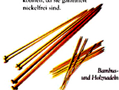
Bambus- und Holz-nadeln