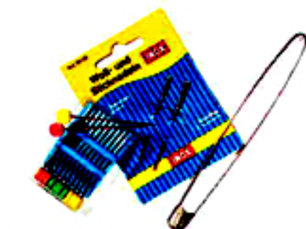
Spannstecknadeln, Wollnadeln, Maschenraffer