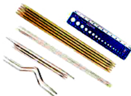
Hilfsnadeln, Nadelspiele, Nadellehre